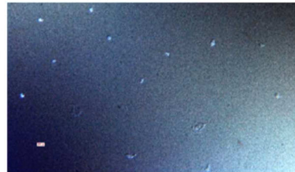
Deposito separato in cluster di TiO 2 con Spray a turbina

Dopo evaporazione Deposito prodotto inefficace perché rarefatto